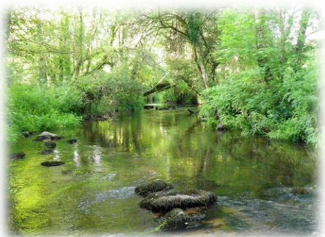
Rivière de L'EVEL